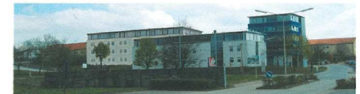
Verschiedene Ansichten: Einfahrtssituation zum Saarpfalz-Park, Oben: Herbst 1997, Mitte: April 2002, Unten: Fotomontage mit 2. Bauabschnitt Gründer- und Mittelstandszentrum.