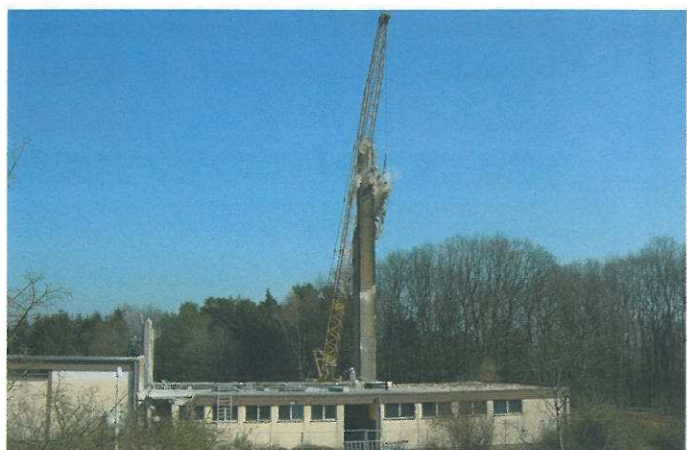
Ehemalige Heizzentrale weicht neuem Bauvorhaben. Der Rettungszweckverband Saar wird in Kürze auf seinem Grundstück im

Saarpfalz-Park mit den Bauarbeiten für seinen neuen Geschäftssitz incl. Schulungszentrum beginnen. Unser Foto zeigt die Abrissarbeiten an der ehemaligen Heizzentrale der Bundeswehr, die sich auf dem Grundstück befand.