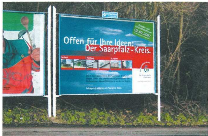
Großflächenplakatierung Anfang 2002. Zwei der 6 Gründerzentren im Saarpfalz-Kreis sind in Bexbach zu finden. Das Gründerzentrum Handwerk bietet Flächen für Existenzgründer im gewerblichen Bereich und ist das erste Zentrum dieser Art im Saarland.