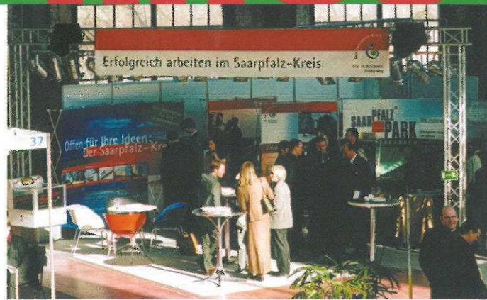
Auf Reges Interesse traf der Messestand der Wirtschaftsförderungsgesellschaft Saarpfalz mbH beim Gründer- und Unternehmerforum, das im Februar auf den Saarterrassen stattfand. Zahlreiche Besucher informierten sich über die hervorragenden Möglichkeiten für Existenzgründer im Saarpfalz-Kreis.