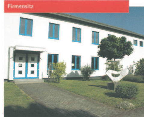
Das Firmengebäude der Prosensys GmbH im Saarpfalz-Park.